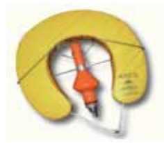
Hoefijzervormige reddingsboei met drijflicht.