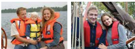
Besto 100N reddingsvest, niet opblaasbaar. Besto 150N reddingsvest, opblaasbaar.

Als een opblaasbaar reddingsvest goed onderhouden wordt, is het even goed als een niet opblaasbaar vest. Een automatisch opblaasbaar reddingsvest kan ook manueel (met de hand) worden geactiveerd. In de meeste gevallen is dat een kwestie van trekken aan een touwtje.